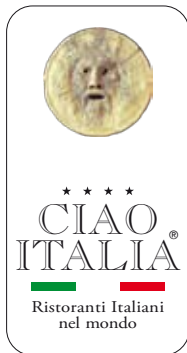
Ministero delle Attività Produttive Marchio Collettivo di Qualità N° RM2006c06624