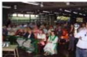
Salón de conferencias/08