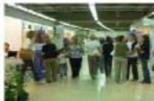
Salón de exposición/08