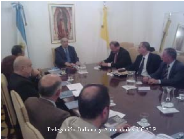
Delegación Italiana y Autoridades UCALP.