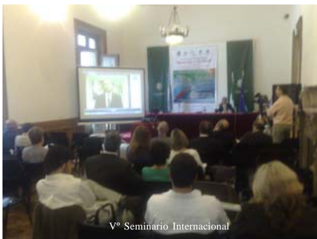
Vº Seminario Internacional