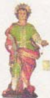
PROTEZIONE di LIMBADI SANT'ITALIA

“Esiste anche una federazione mondiale, la Federation of International Sports Table Football (FISTF)”, ha concluso, Ignacio Beroldo, “che organizza annualmente un campionato mondiale individuale e a squadre, nel cui albo d’oro l’Italia è spesso presente”.