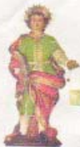
PROTEttore di LIMBADI (SAN PANTALEONE)